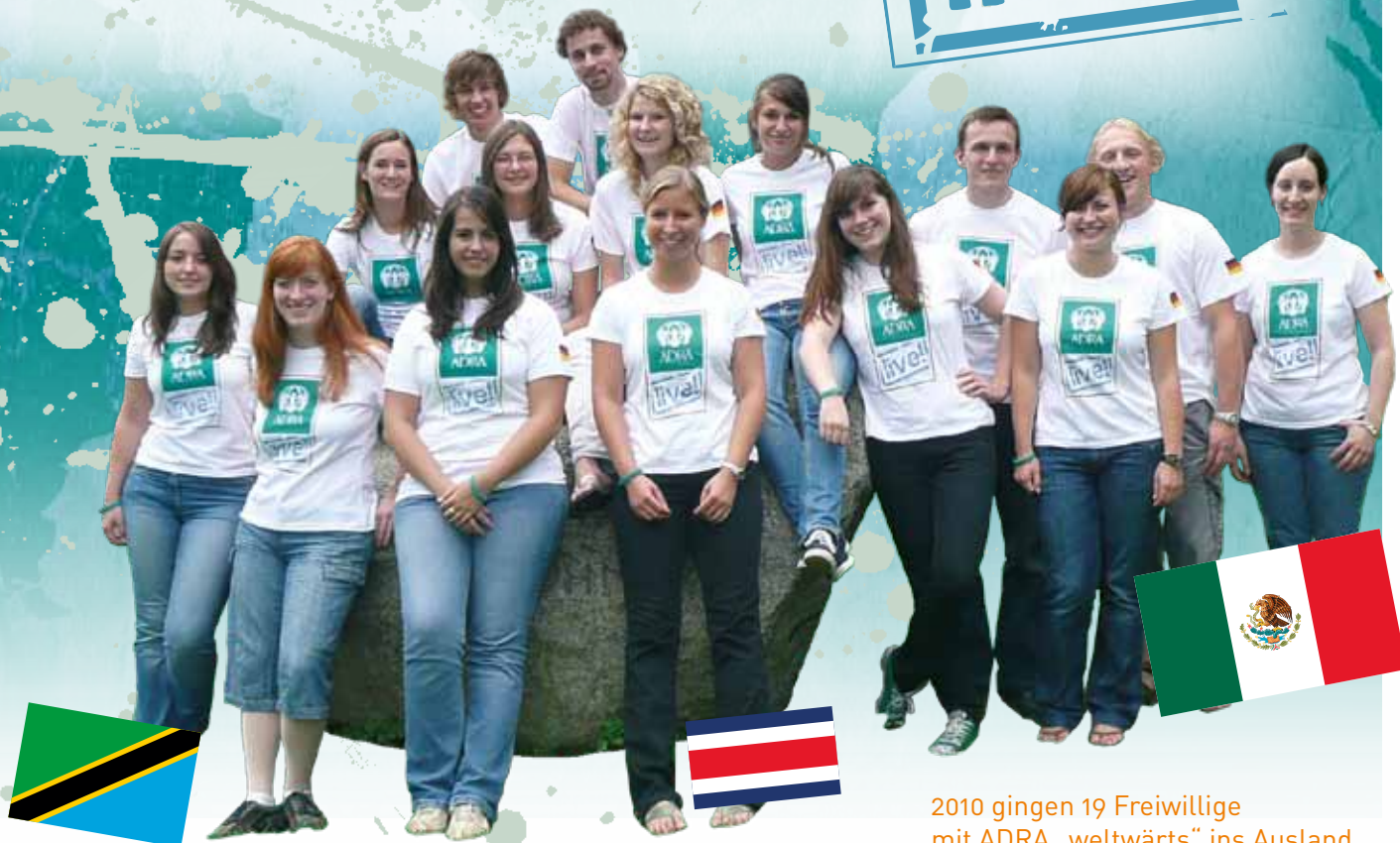
2010 gingen 19 Freiwillige mit ADRA „weltwärts“ ins Ausland